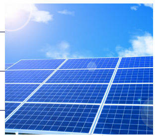
太陽光発電イメージ

※太陽光発電システム設置後、利用期間中(10年間)は売電収入を得ることができません。 ※屋根形状によっては、eソラシードをご利用にならない場合がございます。詳しくは弊社担当までお問い合わせ下さい。