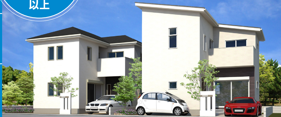
※街並みイメージパースCG