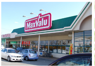
マックスバリュ青山店