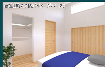
ワークスペース・小屋裏と扉で仕切られたプライベート空間 (主寝室)