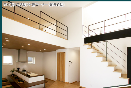
吹抜とストリップ階段が開放的なリビングルーム