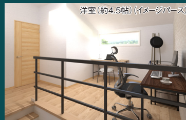
シンプルな半個室のワークスペース