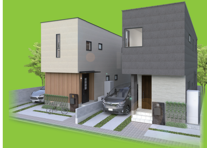
外観イメージパースCG