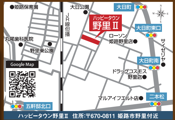
ハッピータウン野里II 住所:〒670-0811 姫路市野里付近