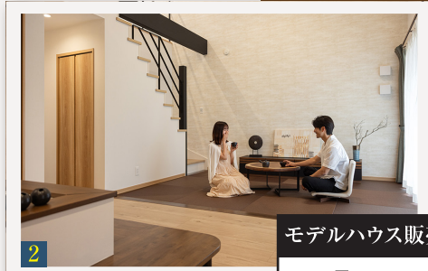
吹き抜けとストリップ階段が 開放的なリビングルーム