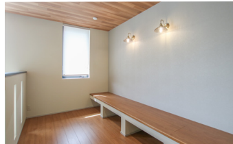
趣味、お子様のスタディコーナーなど多目的に使える約5.0帖のフリースペース