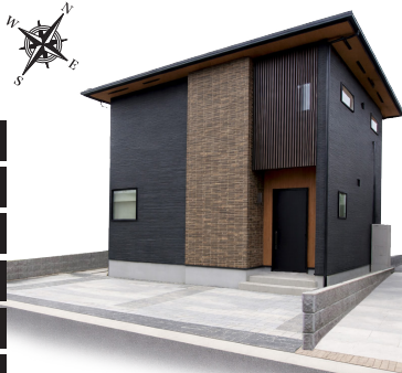
外観イメージパースCG

真鍮やレザー、ウォールナット調の木目の家具でアンティークな雰囲気仕上げられたお家です。