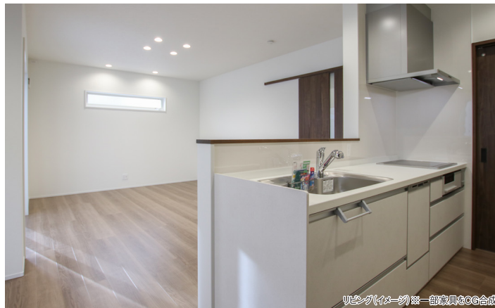
リビング(イメージ)※一部家具はCG合成。

子育て世代に! 高岡西小学校・・・徒歩約12分 JR播磨高岡駅・・・徒歩約15分