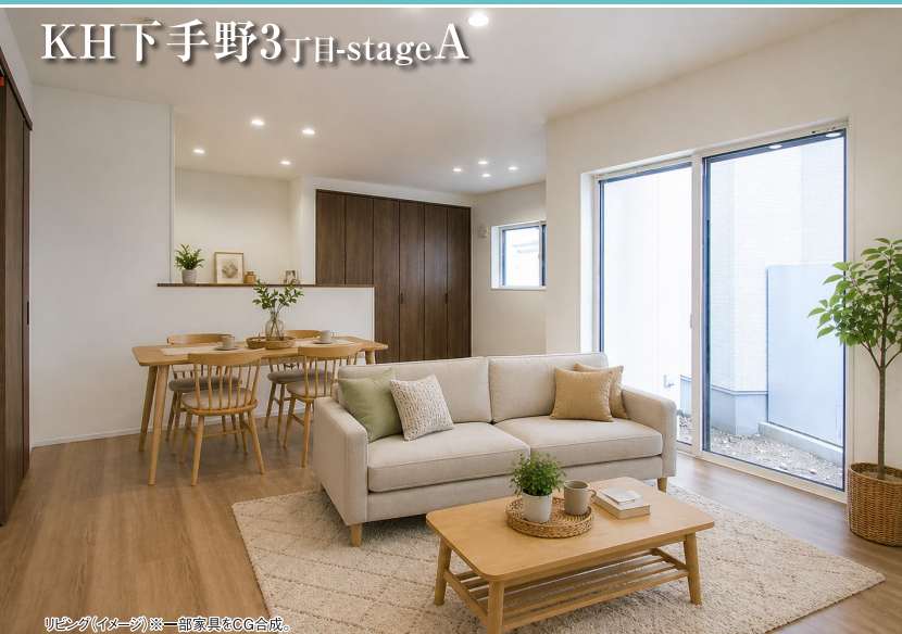
リビング(イメージ)※一部家具はCG合成。