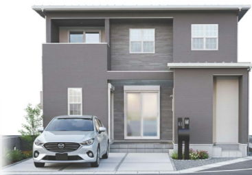
外観(一部自動車をCG合成)