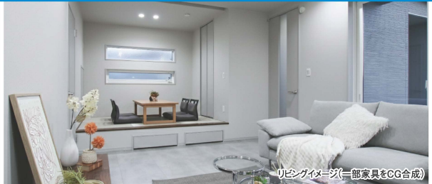
リビングイメージ(一部家具をCG合成)